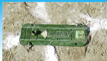
マット(1打目打ちます)