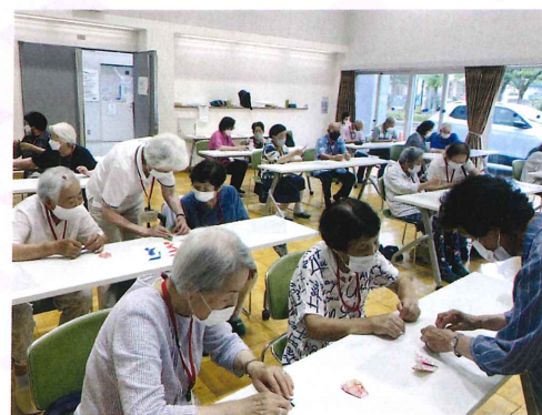
折り紙でクリアファイル作成 (七夕の集い)