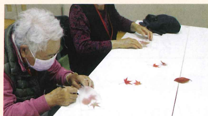
ラミネートで栞(しおり)作り