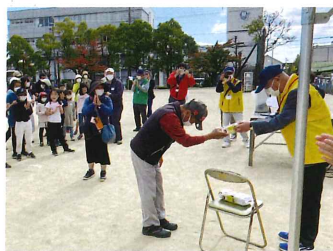
ホールインワン おめでとうございます