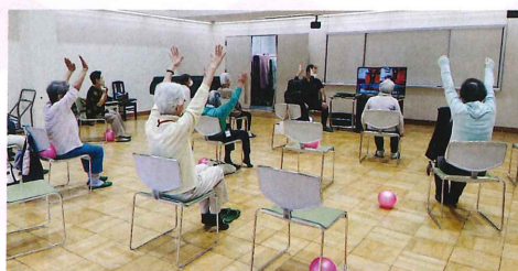
トレーナーと一緒に