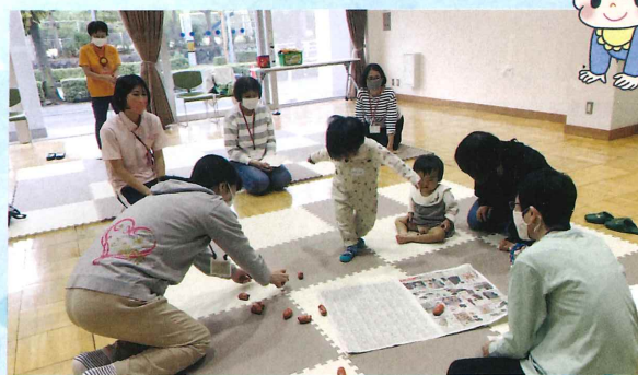
たのしく おあそび