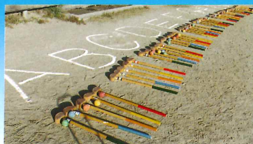
クラブ(ボールを打ちます)