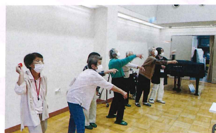
自作の紙飛行機で“舞いあがれ”