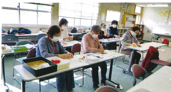
コロナに気をつかいながら作業