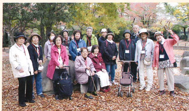
11月14日(日)芦原公園にて