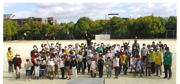
次回も集まろうね