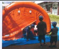
けむり体験に 興味津々な子どもたち