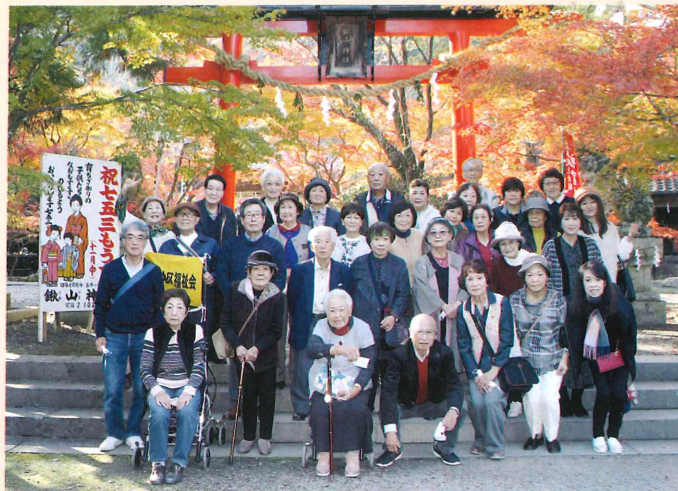
マスクはずして すまし顔

そして京都応援クーポン券でお買物。深まる秋を十分に満喫することのできた楽しい一日となりました。