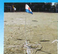
ホールポスト (この輪の中に入れます)