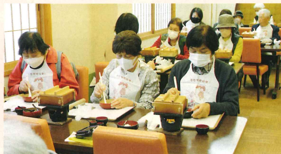
生八つ橋作り 奮闘