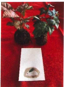
苔玉かざりと和紙の卵

さくらの集いでは年末に以下のサロンを実施しました。12月9日 苔玉づくり 干支 12日 和紙の干支・卵