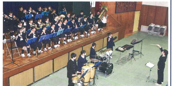
第四中学吹奏楽部による演奏

地域の75歳以上の方が対象の当大会、今年度は189名の参加がありました。第1部表彰式、第2部はアトラクションで、ダンスに演奏、保育園2園のビデオレター、ギター弾き語り、民生委員・児童委員紹介、最後は抽選会と楽しい時間を過ごしました。