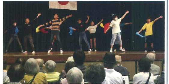
萱野東小5年生有志児童によるダンス