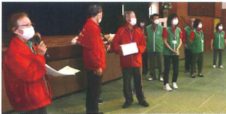
抽選会を進行する福祉会・民生委員

地域の75歳以上の方が対象の当大会、今年度は189名の参加がありました。第1部表彰式、第2部はアトラクションで、ダンスに演奏、保育園2園のビデオレター、ギター弾き語り、民生委員・児童委員紹介、最後は抽選会と楽しい時間を過ごしました。