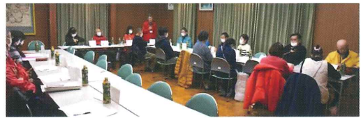
2月9日 ボランティア部会