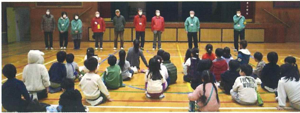
ボランティア・民生委員・福祉会とのお挨拶