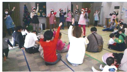
みんなでリズムにあわせて