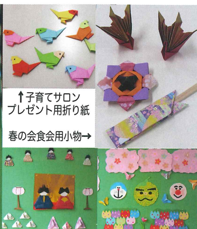
↑子育てサロン プレゼント用折り紙 春の会食会用小物→

ボランティア部会「かきの木」さんは「お元気ですか」のカード作りや活動に使用する小物作りの他に、毎月季節ごとに掲示板に素敵なディスプレイを作られています。どれも力作ばかりでアイデアにもビックリさせられます。