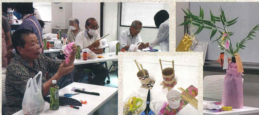
七夕飾りとゲーム大会

当福祉会のいきいきサロンでは、高齢で日中お一人で過ごされている方を中心にご参加頂いております。詳しくは各地区幹事(P4参照)またはお近くの運営委員にお尋ねください。