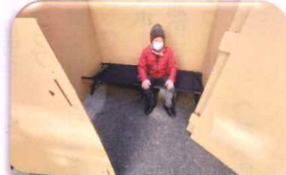
ダンボールハウスと簡易ベッド